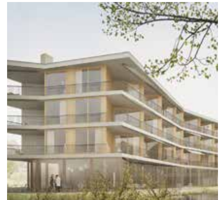
Ein Aufenthalt im Neubau ist als optionales Premium-Angebot erhältlich.

«Wir sind stolz auf den Erweiterungsbau. Mit ihm wächst unser Familienunternehmen um ein weiteres Stück Geschichte – und macht uns fit für die Zukunft.»