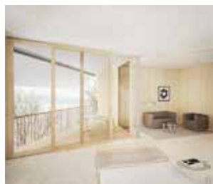
Die Suiten bestechen durch ein luxuriöses und wohltuendes Ambiente.

Der Erweiterungsbau besteht mit natürlichen Materialien und einer lichtdurchflutenden Raumgestaltung. Hier geniessen Gäste, die das Upgrade buchen, eine aussergewöhnliche medizinische Infrastruktur und exklusiven Komfort: Die 22 Superior-Zimmer (40 m 2 ) und je 6 Doppel- sowie Seefront-Suiten (74 m 2 – 79 m 2 ) glänzen mit hochwertiger Ausstattung und verfügen über Balkone mit Seesicht, Schreibtisch und, je nach Kategorie, einem Salon mit Esstisch sowie Ruhebereich. Pro Etage lädt eine stilvolle Lounge mit Terrasse zum Verweilen ein. Die Patientinnen und Patienten können bei Kaffee und frischer, hausgemachter Patisserie den Blick über den einmaligen Schlosspark und den glitzernden See geniessen.