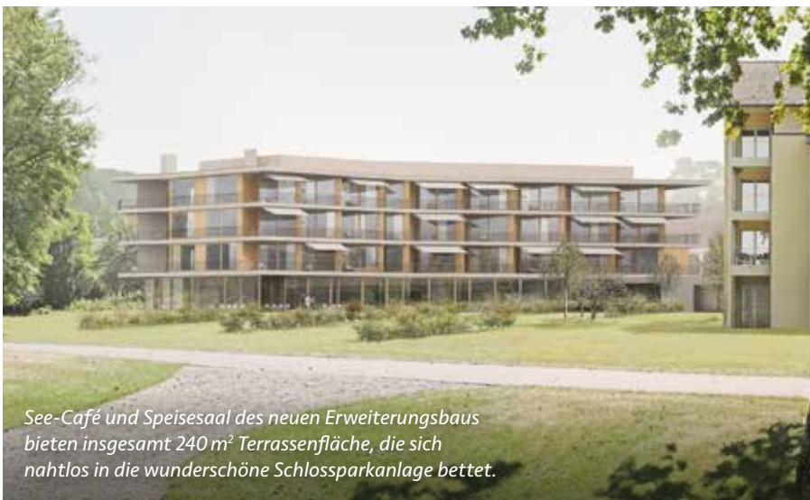
See-Café und Speisesaal des neuen Erweiterungsbaus bieten insgesamt 240 m 2 Terrassenfläche, die sich nahtlos in die wunderschöne Schlossparkanlage bettet.

In der führenden Privatklinik für alle Phasen der Rehabilitation kommen Patientinnen und Patienten in den Genuss der erholsamen Umgebung mit dem gepflegten, 90'000 m 2 grossen Schlosspark direkt am Bodensee. Erstklassige Hotellerie und die exquisite Küche runden das exklusive Ambiente ab. Die Klinik Schloss Mammern erkannte schon früh den positiven Einfluss des Wohlbefindens auf den Heilungsprozess. Nun wird diese einzigartige Kombination aus wohltuender Atmosphäre und medizinischer Exzellenz mit dem neuen Erweiterungsbau in eine neue Ära der über 130-jährigen Klinikgeschichte überführt: Das interdisziplinäre Expertenteam aus ausgewiesenen Fachärzten, Pflegepersonal und Therapeuten kümmert sich wie gewohnt um Gesundheit und Wohlergehen der Gäste. Mit der sogenannten «Healing Architecture», einer gesundheitsfördernden Symbiose aus Architektur, erstklassiger Medizin, teamübergreifender 5-Sterne-Hotellerie und Natur, setzt die Klinik Schloss Mammern neue Standards in der Rehabilitation.